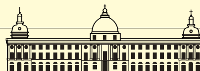
Cité Internationale de la Gastronomie