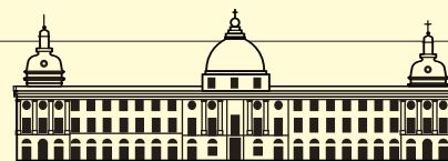
Cité Internationale de la Gastronomie